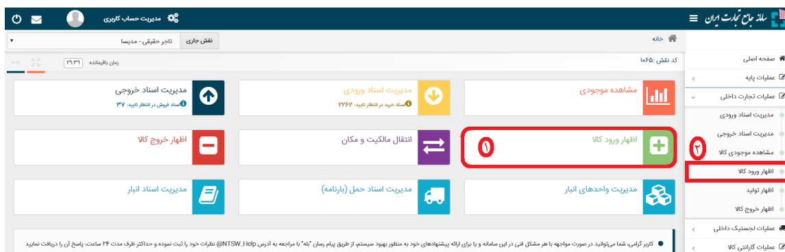
شکل ۱- نحوه دسترسی به منوی ثبت موجودی کالا

۱) پس از معرفی واحد تجاری و ثبت انبار(های) تحت مالکیت خود، با استفاده از نقش تجارت داخلی می‌توانید با استفاده از دسترسی سریع یا از منوی عملیات تجارت داخلی، گزینه "اظهار ورود کالا" را انتخاب نمایید. (شکل ۱)