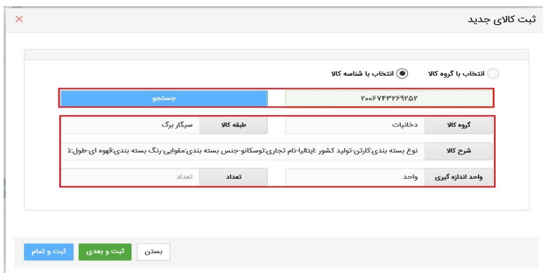
شکل ۸- انتخاب با شناسه کالا