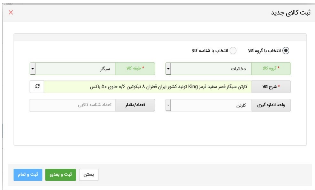
شکل ۷- انتخاب با گروه کالایی